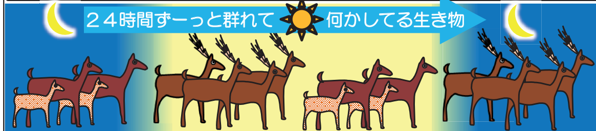
②昼夜問わず活発に動き回る習性、移動・食害・休息も（一部の雄を除き）群れ行動 ※群れは、ほとんどの場合「独立した雄のみ」または「雌と子供」のいずれか