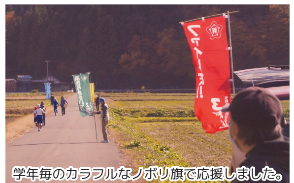
学年毎のカラフルなノボリ旗で応援しました。

この日は保護者や地域の方々が多数訪れ、用意したノボリ旗を片手に沿道から声援を送りました。