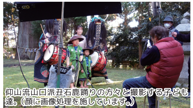
仰山流山口派丑石鹿踊りの方々と撮影する子ども達。(顔に画像処理を施しています。)

当日は陽気に恵まれ、用意した衣装に着替えて撮影が行われました。スタッフなど大勢に囲まれてカメラを向けられた子ども達は緊張していましたが、撮影が進むにつれて表情も和らぎ、自然な笑顔がこぼれました。