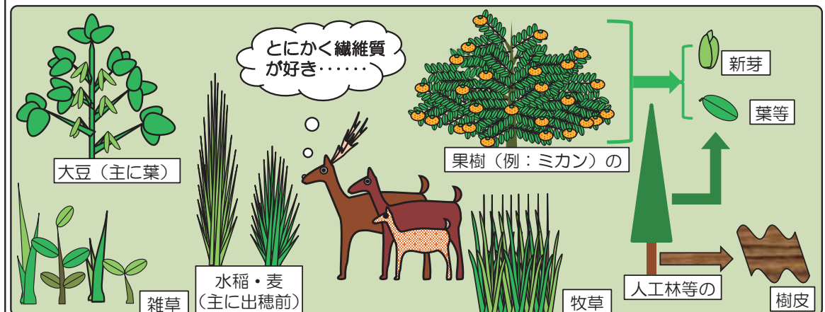
④草食性、樹皮等以外は牛（複数の胃を持つ）の食べるものとほぼ共通の繊維質