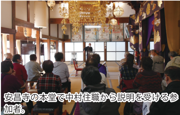
安昌寺の本堂で中村住職から説明を受ける参加者。

No.73 令和3年11月25日 連絡先 興田市民センター内 振興会事務局 74-2201