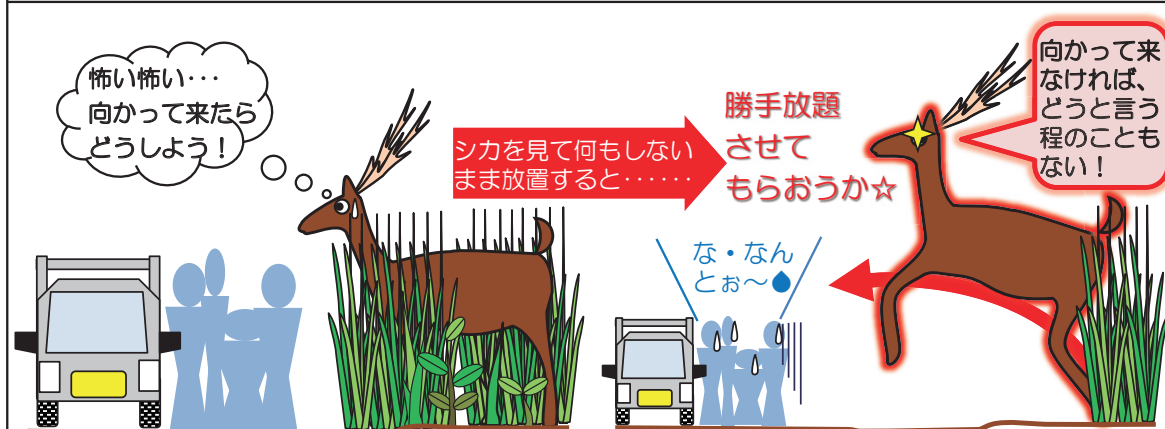
③用心深い一方、危険がないと学んだ途端やりたい放題に（自動車等すら無視！）