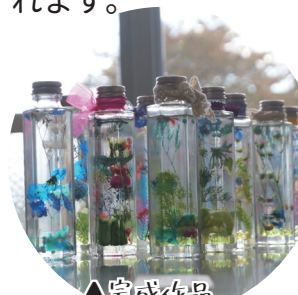
▲完成作品 光にかざすと透け感がとっても綺麗!