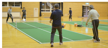
▲コートサイズはこのくらい

バウンドテニスクラブさんへお邪魔してきました。活動時間中ずっと楽しそうにプレーし、常に笑い声が響いていたのが印象的でした。私も体験させて頂きましたが、始めは枠内に入れることが出来ず…その後、的確なご指導で何とか打てるようになってきました。ラケットの貸し出しもある